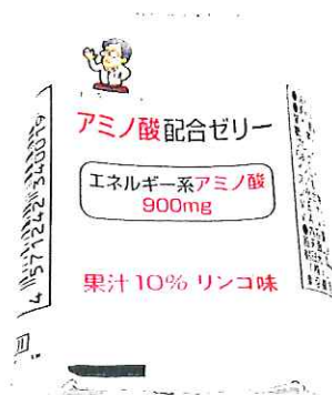
中央部分を押しして全体を広げる